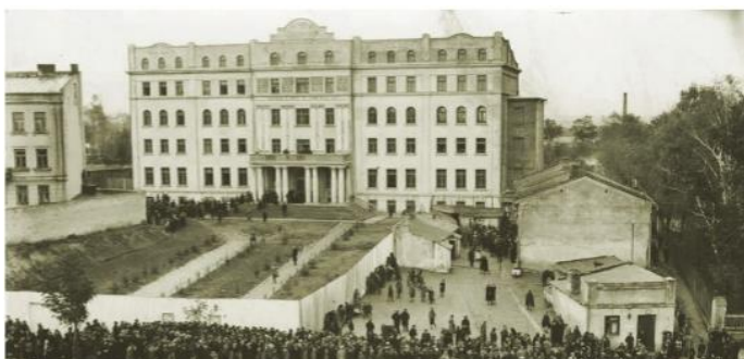
Magnificent building of Yeshivas Chachmei Lublin