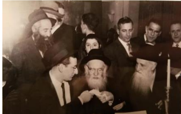
R' Ahron Kotler (center) and R' Avrohom Kalmanovich (right) at a Chasuna. Standing (left) is the Mashgiach, R' Nosson Wachtfogel

although they were Chashuvim , they still didn't get involved in helping the Tzibbur . The Alter of Novardok Zatzal said 6 that the main Achrayus to do Zikkui HaRabbim for Klal Yisroel is on the Bnei Torah . Who were seen riding in a car on Shabbos during the Holocaust to save Yidden ? The two Roshei Yeshiva of the biggest