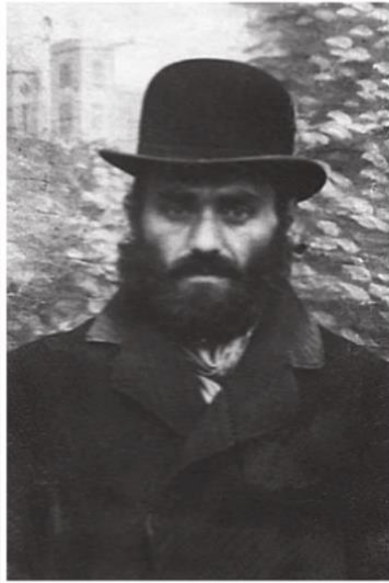
רבי אברהם שמואל פינקל

The image of the K'ruvim hugging each other should give us a sample and a picture of how our disappointments in life can be turned around to extreme Tovah . The hugging K'ruvim are a clear message of the most important Yesod on Tisha B'av in all Yiddishkeit : Gam Zu L'tovah! This is basic Emuna and Bitachon ; that all evil is really good, and even the most extreme evil, like the Churban , is Davka the most Gevaldige goodness. ***** This is what all true Ovdei Hashem call " Aderaba ". אָבן מְאִסוּ הַבּוֹנִים הַיְתֵרָה לְרֵאשׁ פְּנֵה. תהלים ק"ח כב The rejected and disgusting one