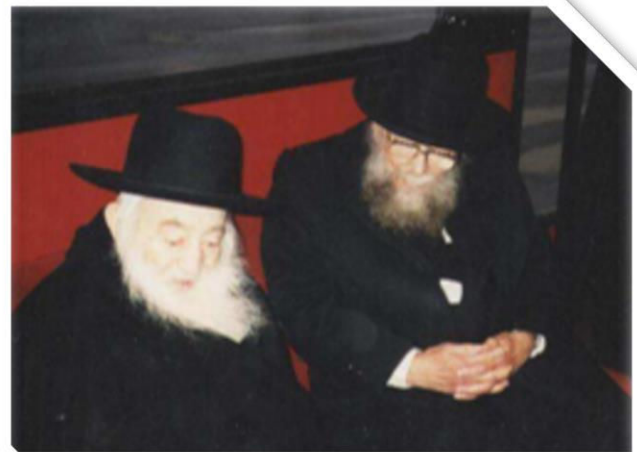
R' Shlomo Wolbe (right) and R' Nosson Wachtfogel (left)

whole Sugya subject of Arayos is synonymous with Bizayon : לא תגלה ערותך. Arayos shames the other person, and the person himself. ** I know a Chashuva Rosh Yeshiva , who deals with many Bachurim who open up to him. He told me that their weaknesses in Inyanei Kedusha destroys their self-esteem, even more than Chilul Shabbos or Lashon Hara . This is why the only true Eitza for Kedusha is learning Torah ( Gemara 17 ), ואין קבֹוד אֶלא תוֹרה, and the only true Kavod is Torah . A Masmid feels a certain Chashivus , and everyone respects a Ben-Torah . R' Shlomo Wolbe Zatzal and R' Nosson Wachtfogel Zatzal 18 and ( L'havdil Bain Chaim L'chaim ) R'