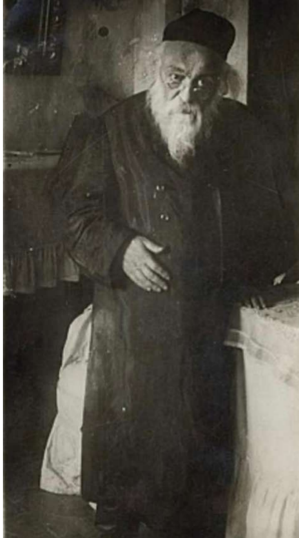
R' Chaim Soloveitchik of Brisk

It is known that R' Ahron Kotler Zatzal sent his Talmidim to far off places like Philadelphia after 5 years in Lakewood in order to be