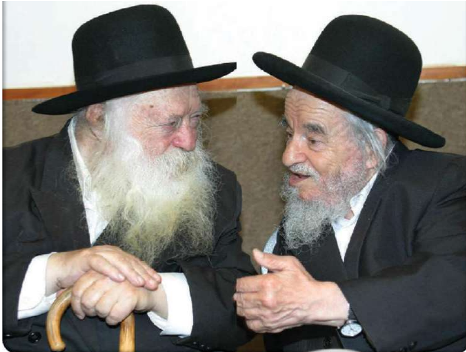
R' Yaakov Galinsky (right) speaking with R' Chaim Kanievsky (left)

He once asked a driver who was taking him somewhere in Boro Park not to go the normal way where people stand and hitch, since he wouldn't be able to take them, and it would hurt their feelings. He was once constantly calling a certain person for different people's telephone numbers. Later, they found out that he once had "Middos" (i.e., a stress in his